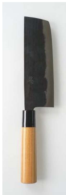
黒打 西型菜切 5.5寸