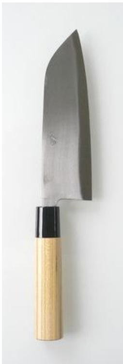
三徳(両刃) 磨 5.5寸