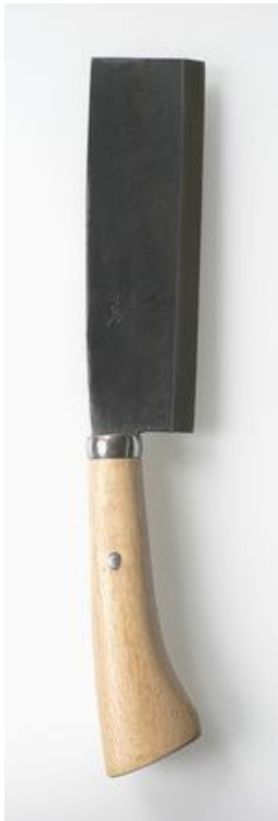
鉈 6寸 片刃