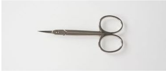
106-3.25\"N ローズ甘皮鉈 ¥4,500 終了