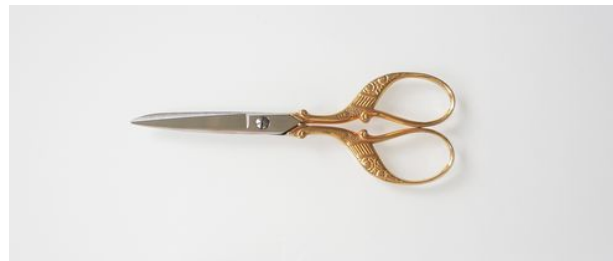
E311-4.5" 孔雀足刺繍鋏 片丸 終了