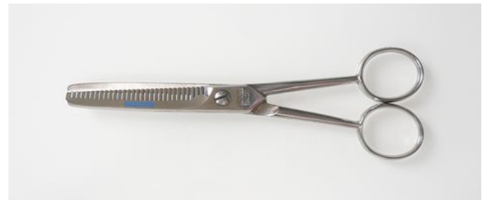
553-6.5R ステン両スキ鉈 ¥10,000