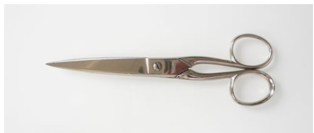
400-6" N 洋鋏 終了