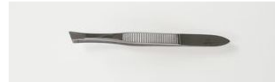
724-3R ツイザー 斜目 終了