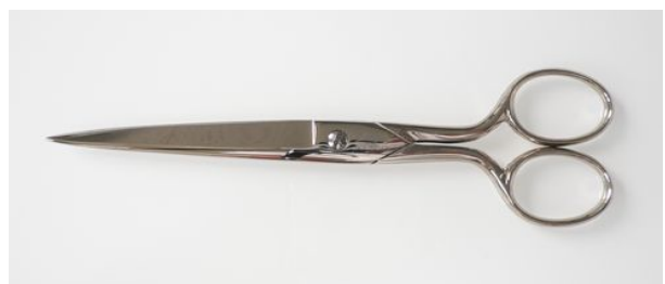
400-7" N 洋鋏 終了