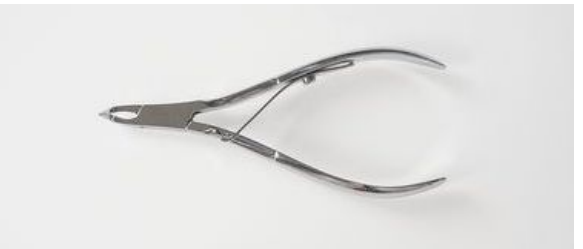
701-4N ニッケル甘皮ニッパー 終了