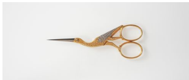
303-4" ツル刺繍鋏 (M) ¥7,400 終了 トホ有り