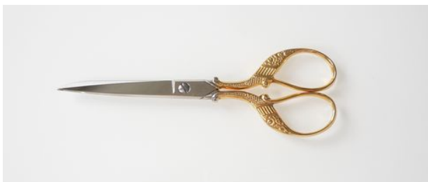
E311-5.5" 孔雀足刺繍鋏 片丸 終了