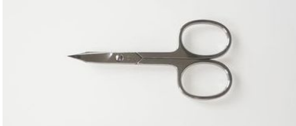
210-3.5R ステン爪切鉈 ¥4,500 終了