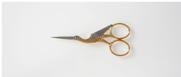
303-3.5" ツル刺繍鋏 (S) ¥6,500 終了 トホ有り