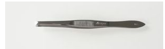
723-3.5R ツイザー 平 ¥1,800