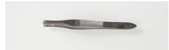
721-3R ツイザー 丸 ¥1,800