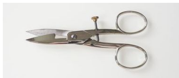
608N ホタンホール鋏 ¥7,000