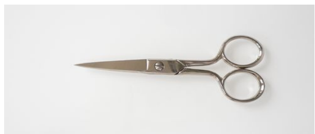
400-5" N 洋鋏 終了