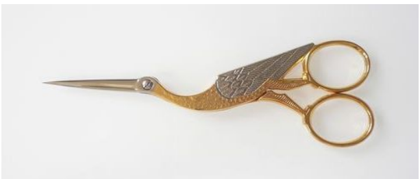
303-6.5" ツル刺繍鋏 (L) ¥11,000 終了