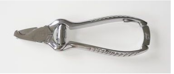
712-5N ニッケルヘッド用爪切 ¥7,000