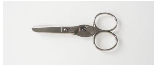
305 シガーカット鉈 ¥5,800