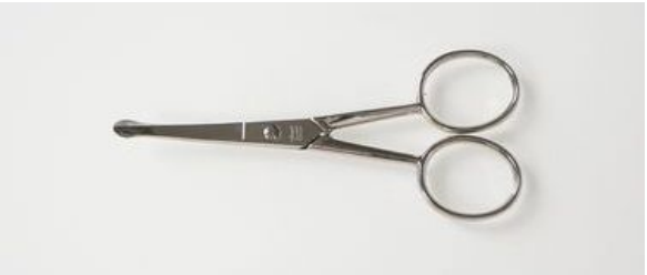
501-4N ニッケル鼻毛鉈 曲 終了