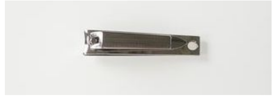
745N 爪切 (60mm) 終了