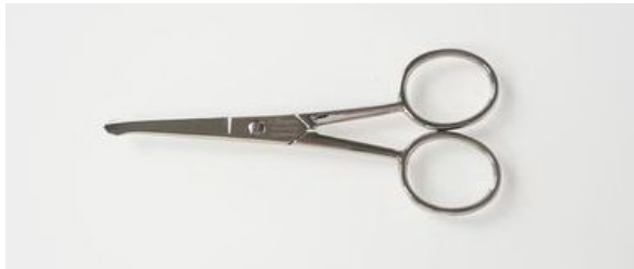
500-4N ニッケル鼻毛鉈 直 終了