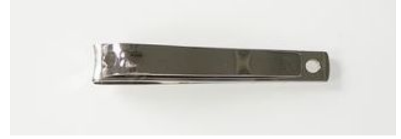
747N 爪切 (85mm) 終了