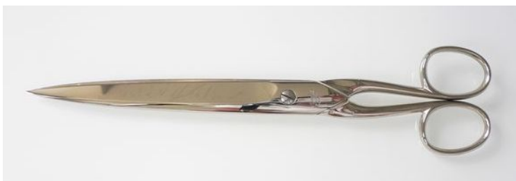
439-9" N テープカットはさみ ¥7,500