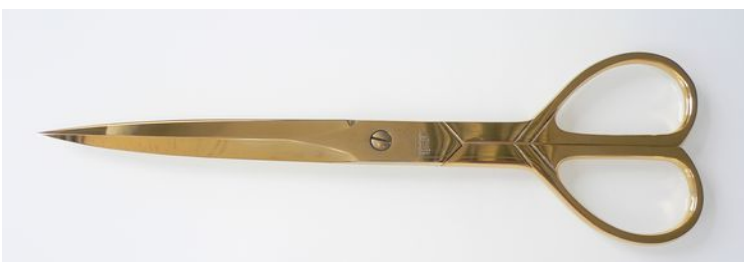
680G 金メッキテープカットはさみ ¥14,000